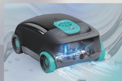
Sistema de tres motores