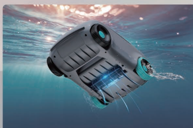
Cepillo de rodillo inferior